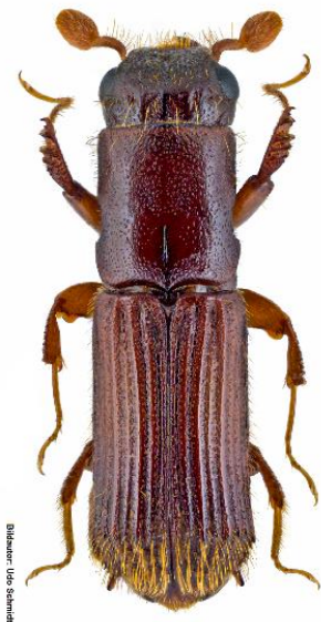
Abbildung 1: Habitus des Eichenkernkäfers ( Platypus cylindrus ).

Frisch eingeschlagene Stämme werden an den Seiten und Unterseiten wegen der dort höheren Holzfeuchte stärker befallen, wobei es oft zu hohen Besiedlungsdichten kommen kann. Die Jungkäfer überwintern in der Mehrzahl im Brutbild; die im Herbst Ausfliegenden bohren sich zur Überwinterung in berindete Stämme ein.