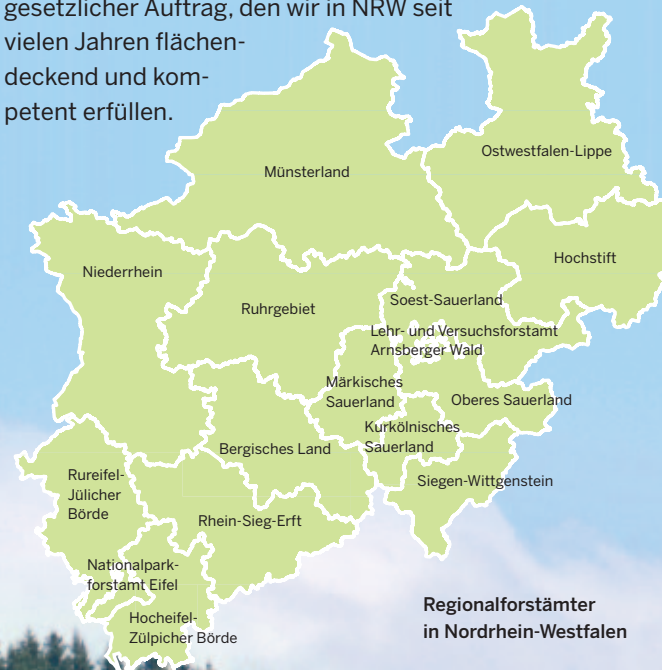
Regionalforstämter in Nordrhein-Westfalen

Ziel von Wald und Holz NRW ist es, dass Eigentümerinteressen und gesellschaftliche Ansprüche dauerhaft möglichst optimal auf derselben Fläche erfüllt werden. Die Betreuung des privaten Waldbesitzes ist unser gesetzlicher Auftrag, den wir in NRW seit vielen Jahren flächendeckend und kompetent erfüllen.