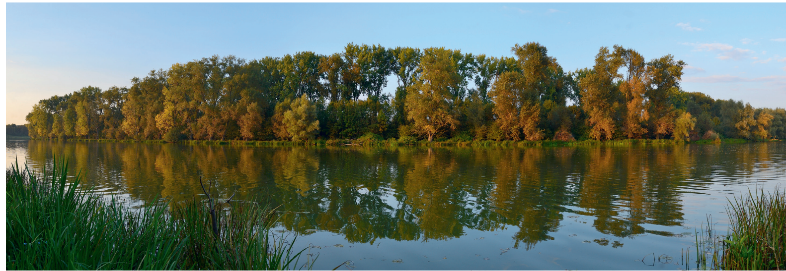
Altrheinarm bei Xanten

Wald und Holz NRW verfolgt konsequent das Prinzip der Nachhaltigkeit. Es wird grundsätzlich nicht mehr Holz eingeschlagen als nachwächst. Die schweren Schäden der vergangenen Jahre lassen auf Forstamts-ebene zurzeit keine konkreten Angaben zum Holzzuwachs zu. Die neue Landeswaldinventur wird hierzu Daten liefern.