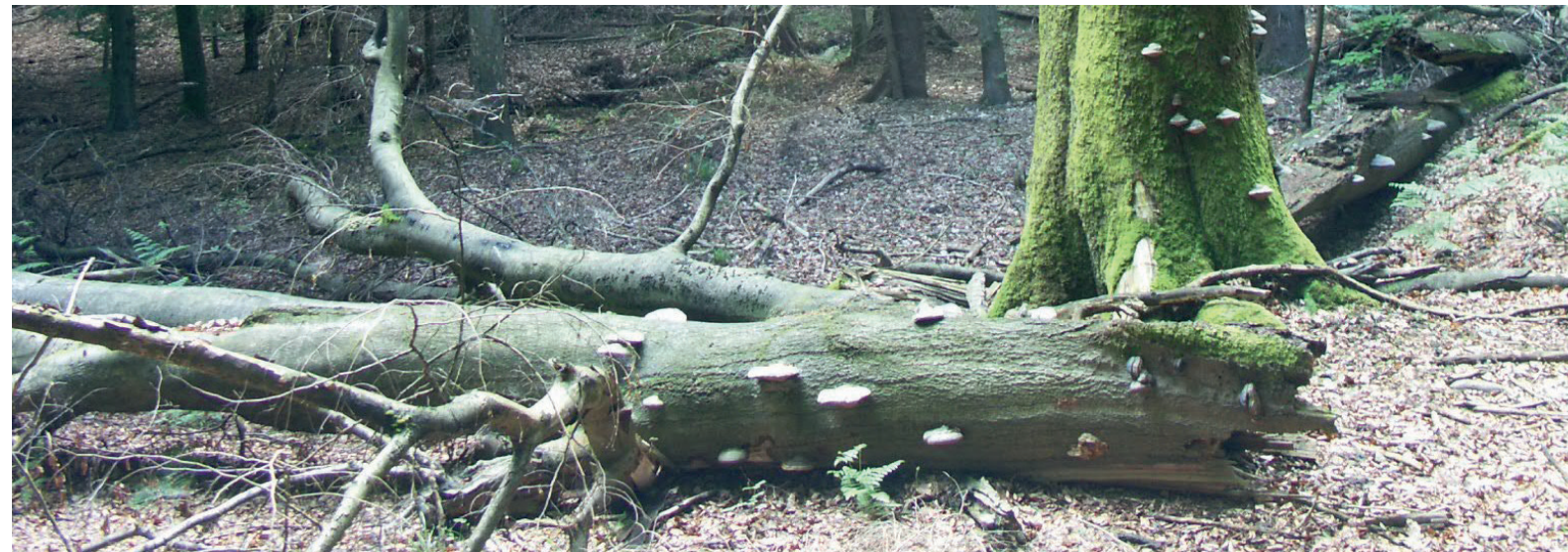
Altholz bietet wichtige Lebensräume.

Vorrangiges Ziel des Regionalforstamtes Rureifel-Jülicher Börde ist es, alle Leistungen des Waldes für die Menschen in der Region nachhaltig zu sichern und zu entwickeln.