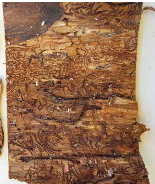
Rinde mit Borkenkäfer vor der Einlagerung: Pro Quadratmeter kommen durchschnittlich 578 Borkenkäfer-Bohrlöcher sowie 287 Borkenkäfer (102 Buchdrucker und 185 Kupferstecher) vor.

Dass die Methode auch mit frisch vom Borkenkäfer befallenem Holz funktioniert, hat das Zentrum für Wald und Holzwirtschaft im Landesbetrieb Wald und Holz Nordrhein-Westfalen dokumentiert.