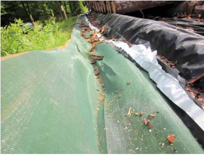
Bodenschutzgitter mit darüber liegender Bodenfolie.