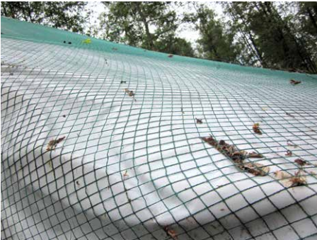
Windschutznetz mit darunterliegender Deckfolie.