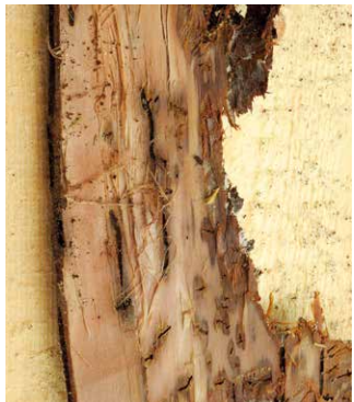
Rinde nach einem Jahr im Folienlager: Die Käfer sind unter der Rinde abgestorben.