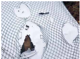
Kleinere Schäden können mit Gewebeband repariert werden.