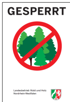
Schild: Landesbetrieb Wald und Holz NRW

Damit das Wild während der Brunft möglichst ungestört bleibt, werden bestimmte Waldflächen einschließlich der Wege für einen befristeten Zeitraum gesperrt. Die betroffenen Flächen werden durch diese Beschilderung abgegrenzt, deutlich kenntlich gemacht und sind somit für Waldbesucher - einschließlich der Pilzsammler - nicht zugänglich.