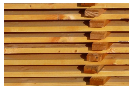
Rundholz zu Bohlen verarbeitet

„Wir haben das Projekt vom Holzeinschlag über den Transport bis zum Einschnitt und zur Trocknung bei einer Tischlerei in Greven begleitet. Trotz eines überdurchschnittlichen Holzpreises im Wald konnte der Handwerksbetrieb unterm Strich sein Schnittholz weit unter dem derzeitigen Marktpreis beschaffen“, betont Forstexperte Hochhäuser.