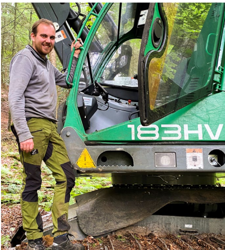
Firma Martin beim Aufarbeiten von Fichtenstammholz

Das Handwerk beklagt, dass alles, was man braucht, um ein Haus zu bauen, derzeit knapp und teuer ist. Das trifft in besonderem Maße auf Bauholz zu, dass in der Baubranche knapp oder teilweise gar nicht lieferbar ist. Dachlatten sind im Preis von etwa 0,40 €/lfd. m auf über 1,60 €/lfd. m gestiegen. Die Folge ist, dass Kunden bis zu 15 Wochen auf die Bearbeitung ihrer Aufträge warten müssen. Ursächlich scheint für die Lage eine starke Exportnachfrage aus China und den USA zu sein. Zwar geht dort die Nachfrage wieder zurück, aber Tatsache bleibt, dass manches Gewerk auf den Baustellen mangels Material warten muss. Bei den Waldholzpreisen ist ein solcher Preisanstieg nicht zu verzeichnen.